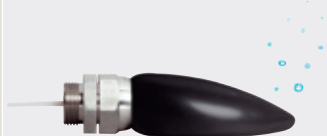
Cabezal de burbujeo EPS 50 para mediciones precisas