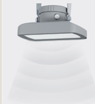
Radar de baja energía para su uso sobre el terreno