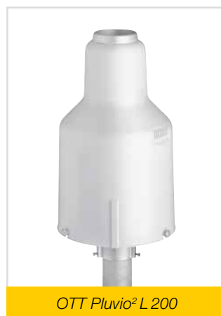
OTT Pluvio 2 L 200

Les deux variantes peuvent être munies en option d'un chauffage de la bague collectrice.