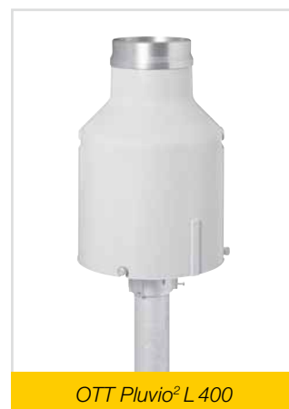
OTT Pluvio 2 L 400