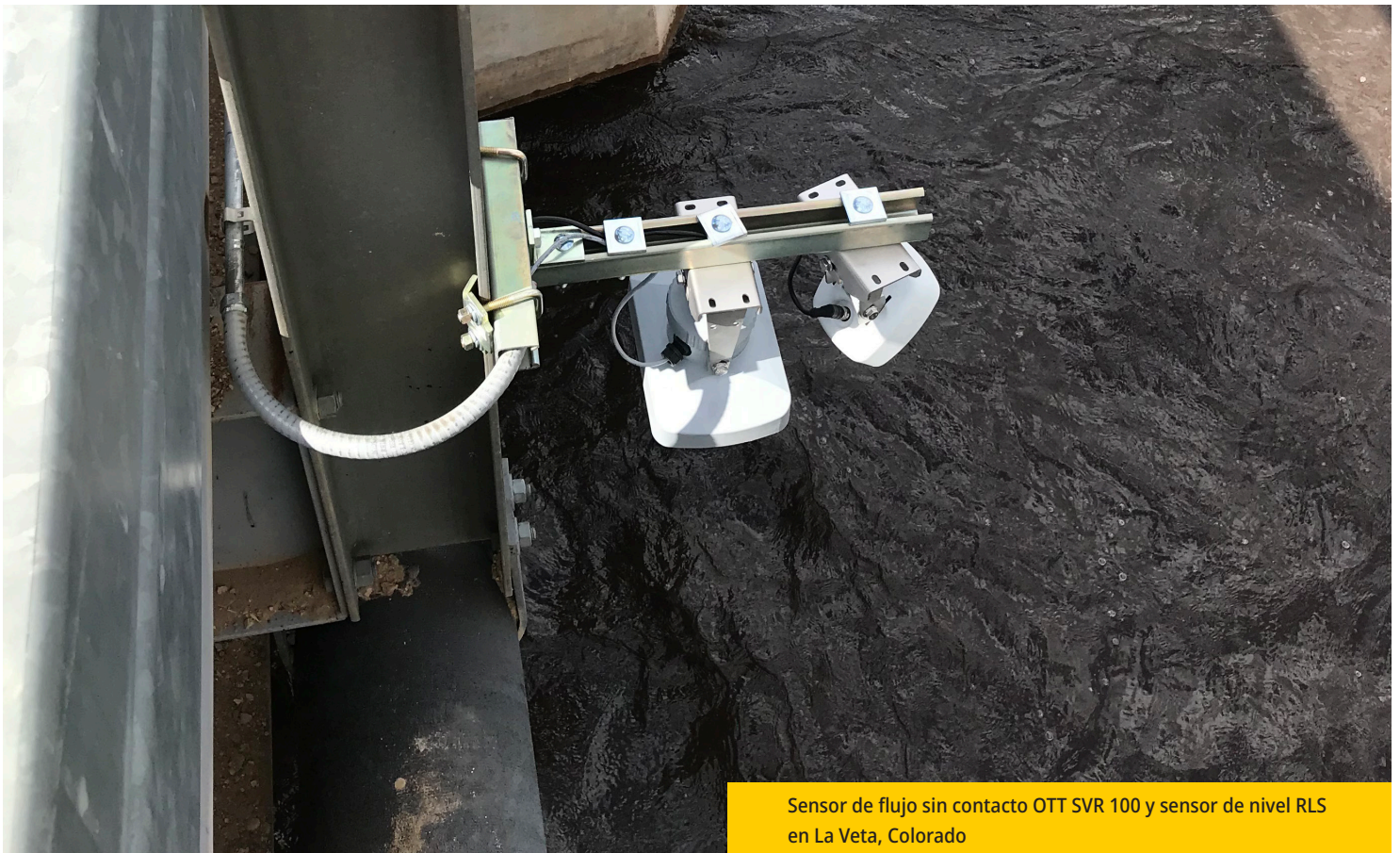
Sensor de flujo sin contacto OTT SVR 100 y sensor de nivel RLS en La Veta, Colorado