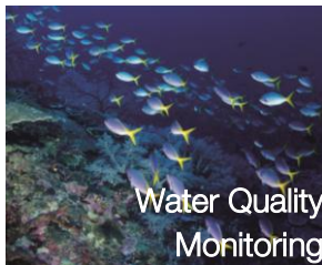
Water Quality Monitoring