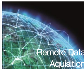
Remote Data Acquisition