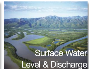
Surface Water Level & Discharge